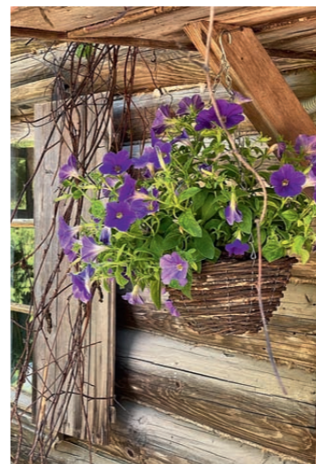
Сад Ракицкого — образец настоящей русской дачи со всеми её милыми деталями.