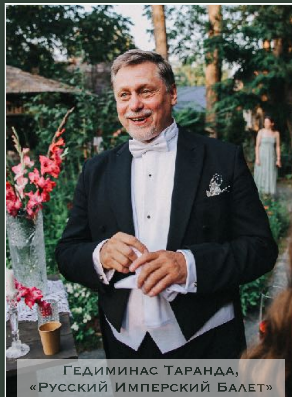
ГЕДИМИНАС ТАРАНДА, «РУССКИЙ ИМПЕРСКИЙ БАЛЕТ»

ЗВЕЗДЫ НЕ ТОЛЬКО ВЫСТУПАЮТ НА НАШЕЙ СЦЕНЕ, НО И ПРИХОДЯТ В ГОСТИ СПРЯТАТЬСЯ ОТ МОСКОВСКОЙ СУЕТЫ